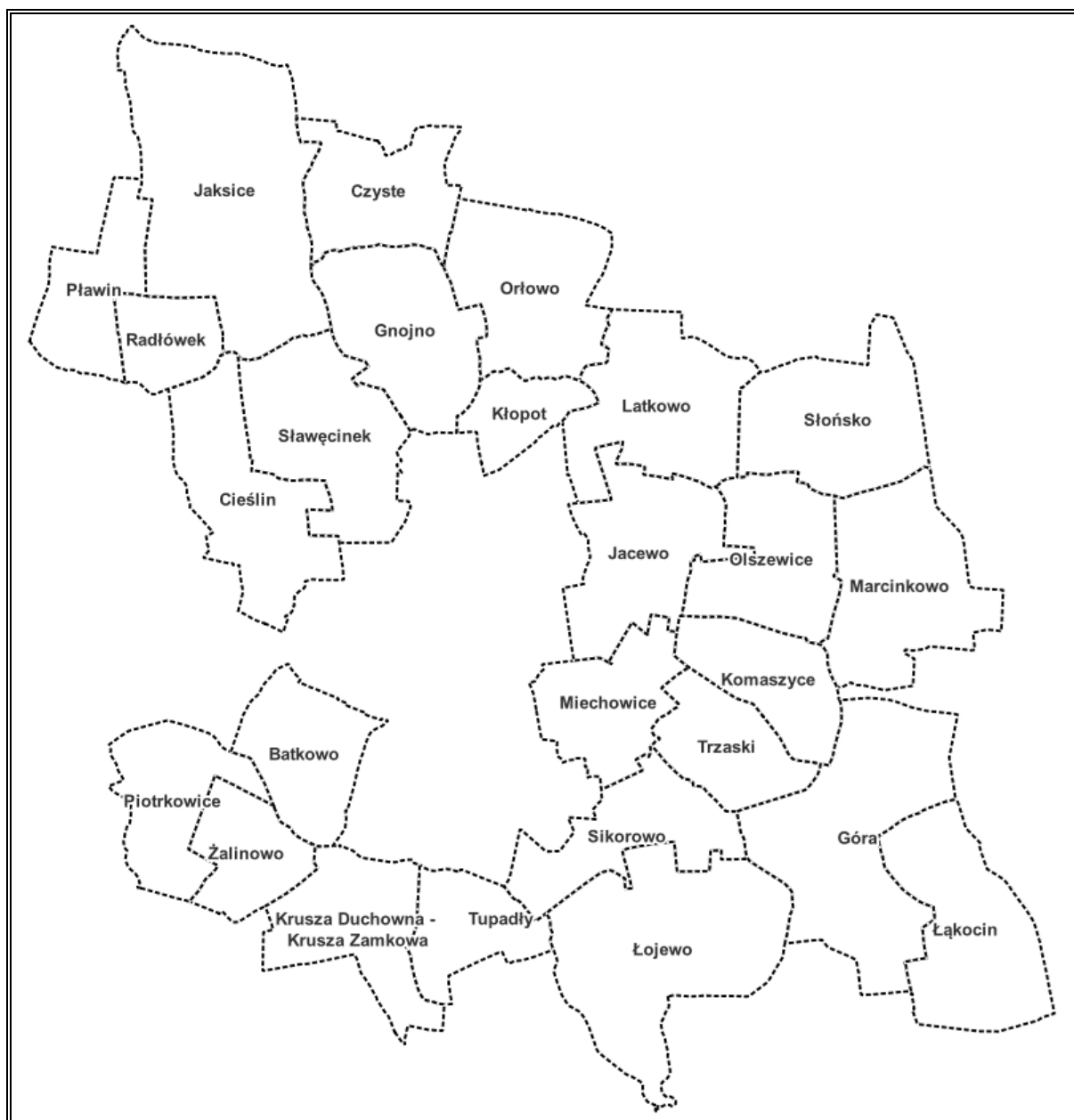
Rysunek 1. Podział Gminy Inowrocław na jednostki osadnicze według stanu na dzień 25.11.2024 r. 1

W celu przestrzennego zobrazowania wyników analizy, Gminę Inowrocław podzielono na jednostki osadnicze, składające się z jednej lub kilku miejscowości.