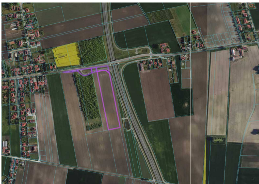
Ryc. 3 Położenie analizowanego obszaru wraz z zagospodarowaniem sąsiedniego terenu

Obszar objęty prognozą to tereny rolne przeznaczone pod uprawę polową, znajdujące się po zachodniej stronie obwodnicy, w miejscowości Jacewo. W skład obszaru wchodzi działki o nr. 186/2, 186/1, 185/1, 184/4, 184/6, 183/1, o łącznej powierzchni około 2,7 ha, stanowiące użytki rolne o wysokiej klasie bonitacyjnej (RIIIa) oraz drogi. Teren objęty przystąpieniem od strony północnej graniczy z drogą powiatową nr 2545C (ul. Świerkowa) Jacewo – Ośniszczewko, od strony wschodniej z obwodnicą miasta Inowrocławia, a od południa i zachodu z polami uprawnymi oraz porzuconą, zdegradowaną plantacją drzew owocowych. W najbliższym otoczeniu terenu objętego prognozą występuje zarówno zabudowa zagrodowa, jak i mieszkaniowa jednorodzinna, infrastruktura techniczna oraz rola.