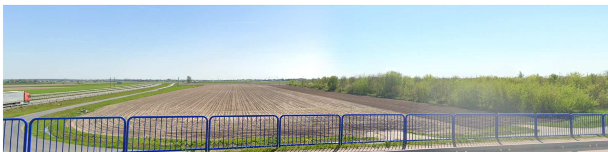
Fot. 1 Obszar opracowania (widok z obwodnicy Inowrocławia)

Teren objęty przystąpieniem do sporządzenia miejscowego planu zawiera się w obszarze obowiązującego już miejscowego planu zagospodarowania przestrzennego przyjętego Uchwałą Nr XIV/123/2016 Rady Gminy Inowrocław z dnia 18 lutego 2016 r. na obszarze gminy Inowrocław w części miejscowości Jacewo, w którym obszar ten przeznaczono na cel rolny R (bez szczegółowych ustaleń).